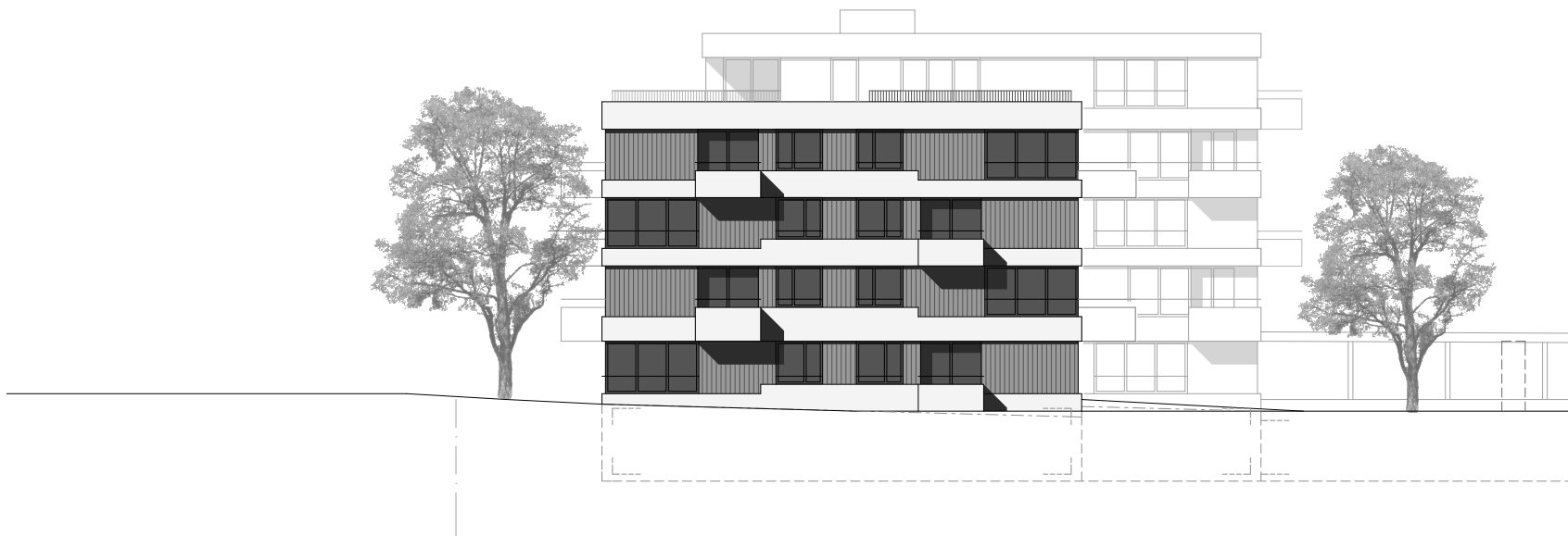
Haus B, Ansicht Süd